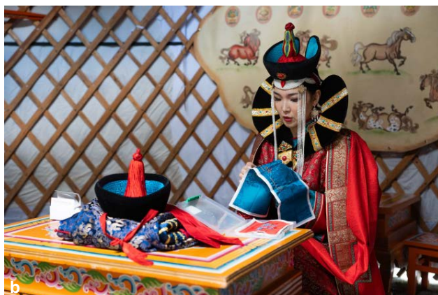
Ryc. 3a, b. Mongolska jurta – prezentacja elementów naturalnej medycyny mongolskiej