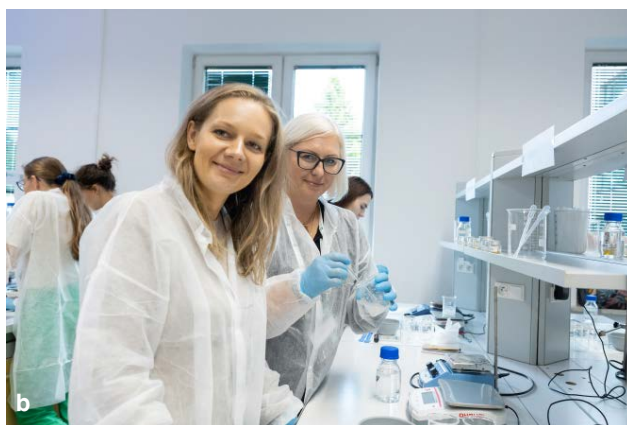
Ryc. 2a, b. Warsztaty z wykorzystania modeli 3D ludzkiej rogówki zorganizowane przez firmę MatTek (a) oraz warsztaty z recepturowania kosmetyków naturalnych, które prowadzili pracownicy Katedry Kosmetologii WSiIZ (b)