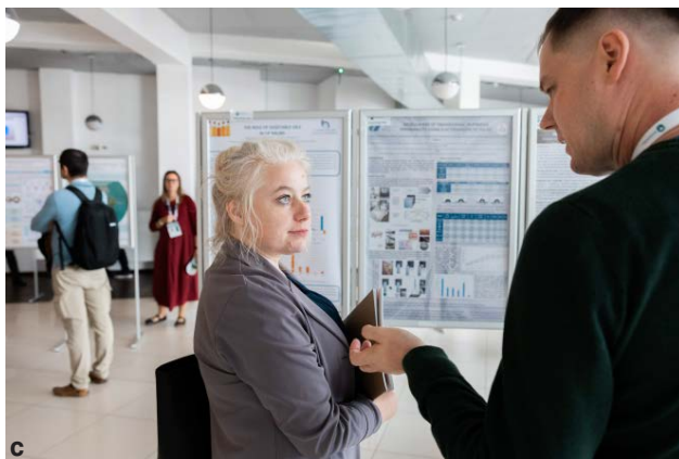
Ryc. 4c. Sesja posterowa

Konferencja została objęta szerokim patronatem medialnym, m.in. przez portale branżowe oraz czasopiśma naukowe i popularnonaukowe, a także regionalne media, takie jak TVP3 Rzeszów. Wydarzenie wsparli również partnerzy przemysłowi, w tym firmy Anchem, Colfarm, Shim-Pol, A.P. Instruments oraz Orcideo.