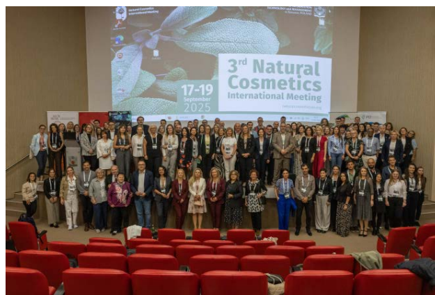
Ryc. 5. Wspólne zdjęcie

Szczegółowe informacje dotyczące programu oraz warsztatów dostępne są na stronie internetowej konferencji: https://naturalcosmeticsim.org/ .